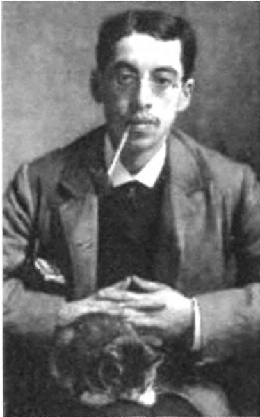
Arnold Aletrino, porträtiert von Jan Veth, 1885

Arnold Aletrino (* 1. April 1858 in Amsterdam; 17. Januar 1916 in Chêne bei Montreux) war ein niederländischer Arzt, Anthropologe und Autor, der mehrere Werke über Homosexualität in der niederländischen und französischen Sprache veröffentlicht hat.